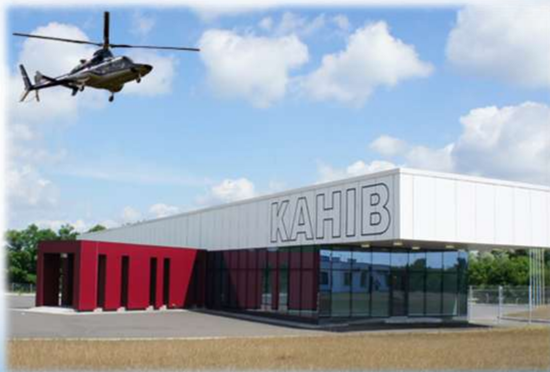
Вертодром «Вертолетная площадка Канев (Пекари)»